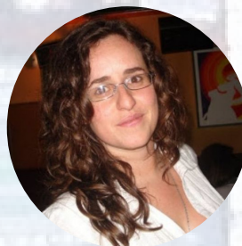
Cultura Dumia Pernas Otero