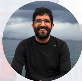
Reseña Literaria Carlos Silva García